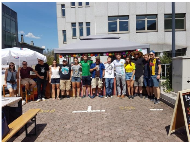
Unser Stand am Staatsfeiertag