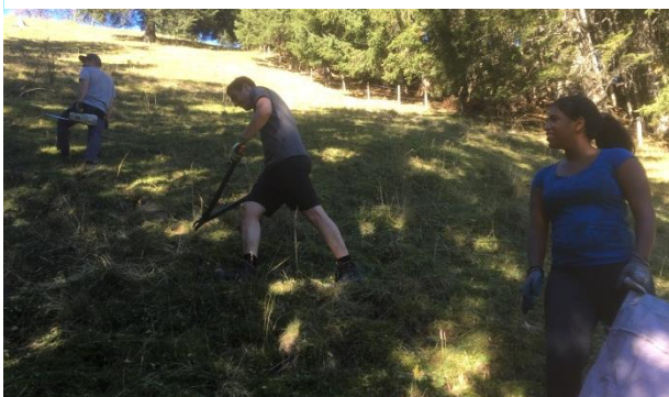
Voller Einsatz am Alpwerktag in unseren Bergen