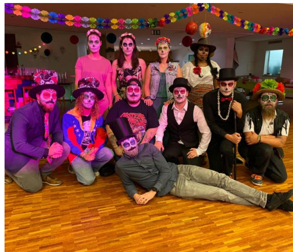
Mottoparty zum 2. November im Dorfsaal Triesenberg