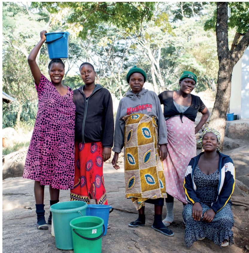
Mit diesem Projekt soll der Bevölkerung in Simbabwe geholfen werden.

Das Gesundheitszentrum im abgelegenen Samu wurde vor 19 Jahren durch einen Wirbelsturm zerstört. Seither liegt das Personalhaus in Trümmern. Während die Klinik wiederaufgebaut wurde, ist das medizinische Personal gezwungen, in den einfachen Mütterwartehäusern zu wohnen. Gemeinsam mit ihren Familien teilen sie sich eine einzige Toilette und nutzen den Waschplatz des Gesundheitszentrums. Strom gibt es keinen. Mütterwartehäuser dienen eigentlich einem anderen wichtigen Zweck, wie der Name schon sagt: hochschwangere Frauen aus entlegenen Dörfern warten in den einfachen Räumen auf die Geburt ihres Kindes. So sind sie bei allfälligen Komplikationen rechtzeitig in der Klinik und erhalten medizinische Hilfe. Das Konzept der Mütterwartehäuser wird in vielen Ländern Afrikas erfolgreich angewendet, vor allem in ländlichen Regionen, wo die Distanzen weit sind und der Weg zur Klinik